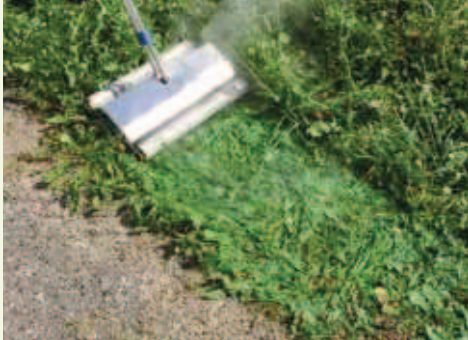
Traitement à la vapeur

Le contact de la vapeur à 150° sur la plante produit un éclatement immédiat de la cellule végétale, la plante se dessèche naturellement et le résultat est visible au bout de quelques jours. La vapeur diffusée en pression sur les surfaces à traiter permet, sur le même principe d'éclatement cellulaire, de neutraliser en un seul passage le collet de la plante, la base racinaire et les graines en dormance dans les premiers centimètres du sol (effet curatif et préventif à la fois)