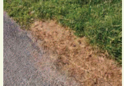
8 jours plus tard...